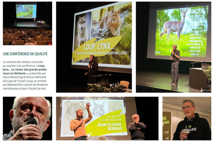
UNE CONFÉRENCE DE QUALITÉ

Nous tentons de collaborer avec d'autres structures (illustrations : des vétérinaires) afin de s'enrichir mutuellement.