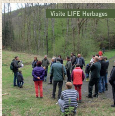
Visite LIFE Herbages