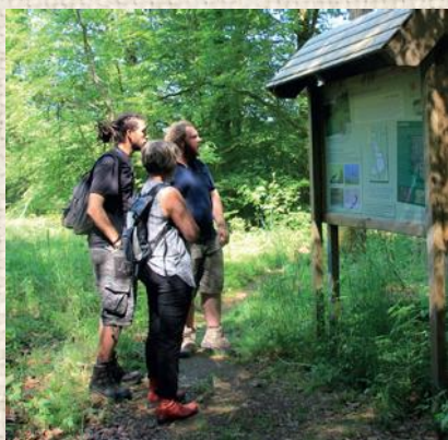
Gestion de réserves naturelles

Bertrix : diffusion d'une brochure-programme de 20 pages couleur : « A la découverte de richesses naturelles de Bertrix » ➡ Organisation d'une vingtaine d'activités de sensibilisation.