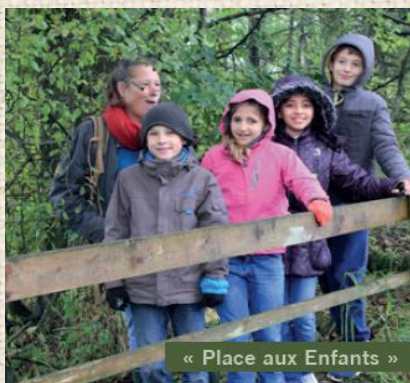
« Place aux Enfants »